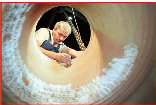
Ukrašavanje zvona reljefima i tekstom