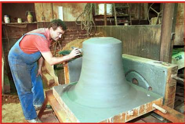
Izrada kalupa zvona od pijeska