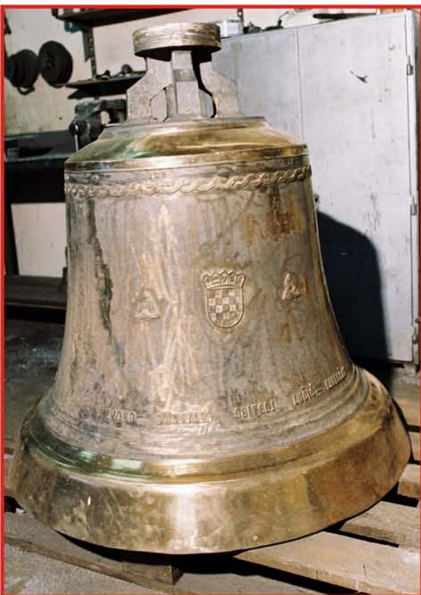
Odlijano zvono spremno za patiniranje

Zvono je vrhunsko dostignuće ljevača, tisućljetno iskustvo vrhunskih majstora koje se pokoljenjima prenosilo sa oca na sina. Ta umjetnost bila je tajna, koju je majstor zvonoljevač ostavljao svojim nasljednicima kao najveće blago i najdragocjeniju baštinu.